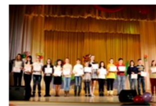
Награждение победителей II этапа ФШД